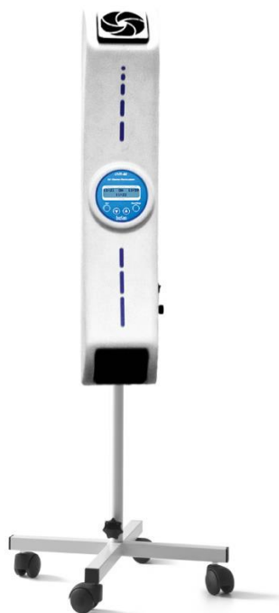
2. attēls. UVR-Mi recirkulators uz statīva